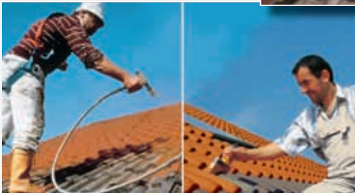
Verarbeitung mit Airless- Spritzpistole, Rolle oder Flächenstreicher.